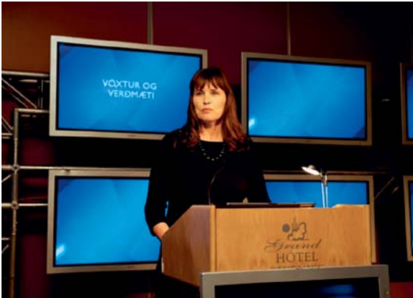
Erlent eignarhald þýðir að Íslendingar bera lágmarksáhættu af sveiflum á heimsmörkuðum.