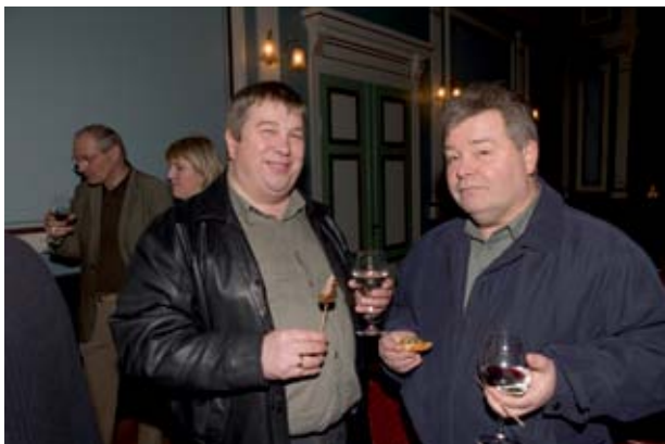
Útskrift græn- og svartbelta