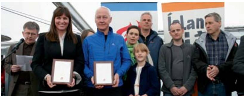
Tekið á móti viðurkenningu fyrir bestan árangur við athöfn í Fjölskyldu- og húsdýragarðinum.

Um tvö hundruð starfsmenn ISAL í 26 liðum tóku þátt í áttakinu og fóru samtals 20.650 kílómetra. Það gerir um 103 kílómetra að meðaltali á hvern þátttakanda. Af einstökum liðum innan fyrirtækisins fór 10 manna lið Flúorfáka lengsta vegalengd eða 3.677 kílómetra. Állið, sem einnig var skipað 10 þátttakendum, fór 3.021 kílómetra.