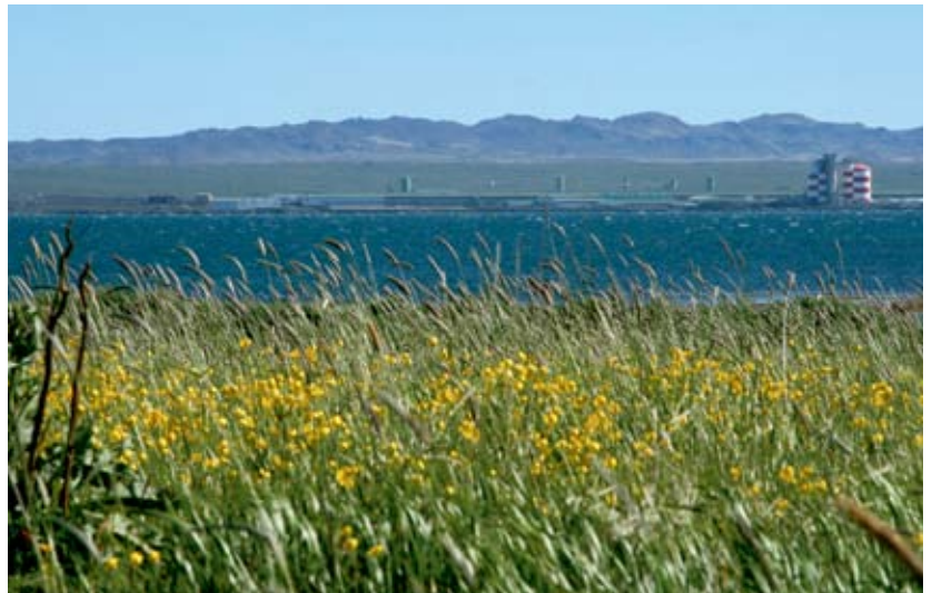
Straumsvík séð frá Álftanesi.

Slysavarnafélagið Landsbjörg: kr. 250.000,- Til reksturs á verkefninu „Björgunarsveitir á hálendinu“.