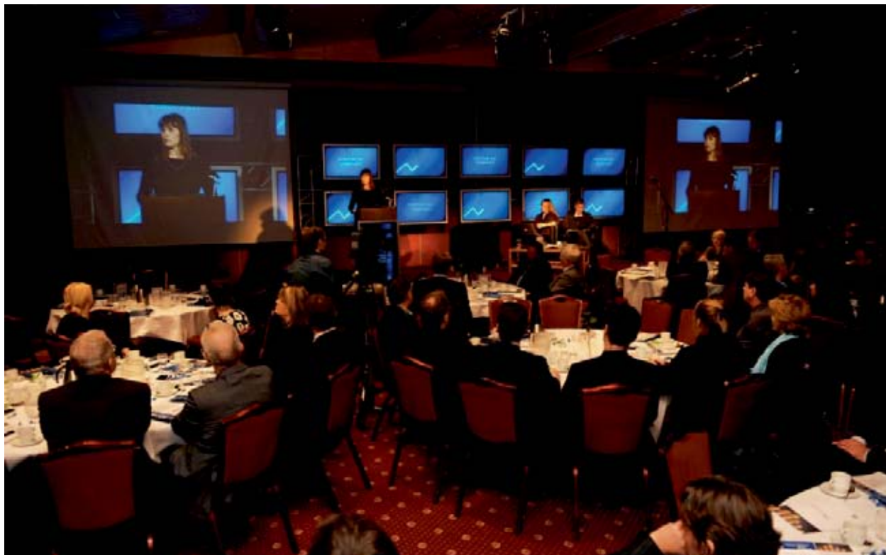
Jafnvel í dag, eftir hrunið, velta menn fyrir sér efnahagslegum áhrifum stóriðju og segja sem svo: „Það eru engin verðmæti í þessum störfum – það hefðu hvort sem er orðið til önnur störf í staðinn.“ En hvar eru öll þessi störf í dag?

upp í 13 þúsund. Það eru þó ekki nema um 40% af því vatnsafla sem ætla má að sé nýtanlegt bæði út frá efnahagslegum og umhverfislegum sjónarmiðum, samkvæmt mati sem er sett fram á vef rammaáætlunar ríkisstjórnarinnar.