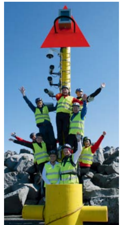
Állið í góðum gir.