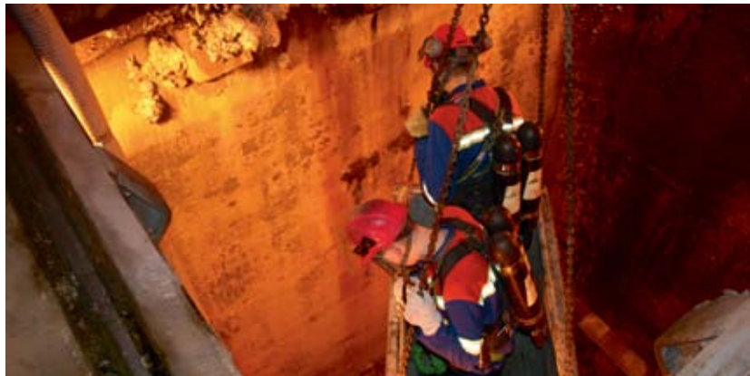
Slökkvilið ISAL æfir björgun úr lokuðu rými í Steypuskála.

Markmið æfinganna var að bjarga tveimur fórnarlömbum úr steypugryfjum án þess að nota brúkrana, enda henta þeir ekki til slíkra verka af ýmsum ástæðum; þeir geta bilað á ögurstundu og eru auk þess svo öflugir að þeir geta valdið mönnum skaða ef eitthvað ber út af við björgunina. Verkefni sem þetta er mjög tæknilegs eðlis, bæði er varðar sérhæfðan búnað og þekkingu. SHS á nokkuð af búnaði til verksins og býr yfir ágætri þekkingu. Því var mikilvægt fyrir okkur hjá ISAL að læra