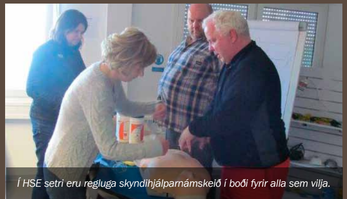
Í HSE setri eru reglulega skyndihjálpu námskeið í boði fyrir alla sem vilja.