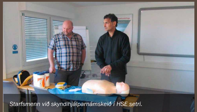
Starfsmenn við skyndihjálpu námskeið í HSE setri.

Mundu að skyndihjálpu getur bjargað mannlífum! Hefur þú sótt námskeið nýlega? Í HSE setri eru reglulega skyndihjálpu námskeið í boði.