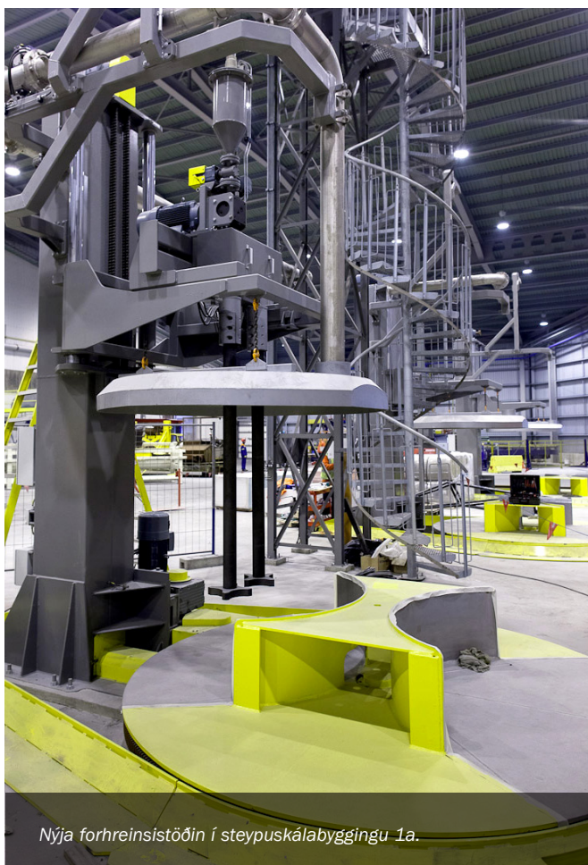
Nýja forhreinsistöðin í steypuskálabýggingu 1a.

Áætla má að um 35-40 manns hafi unnið í stöðvunum í allt frá hönnun að uppsetningu. Öll hönnun, smíði og uppsetning var unnin af VHE nema á rafmagnshönnun á þéttflæði kerfi þar sem STAKI var að störfum.